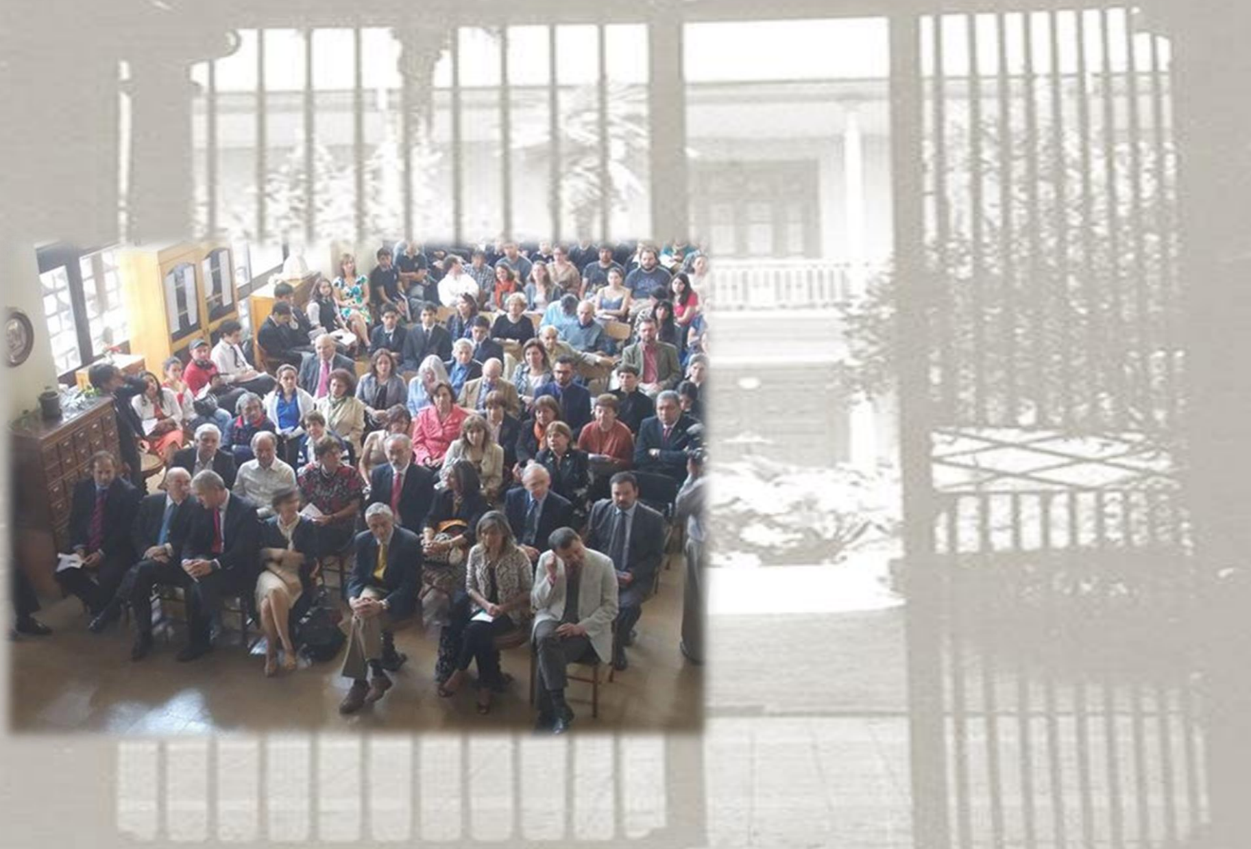
Ceremonia de Inauguración del Archivo del Instituto Nacional