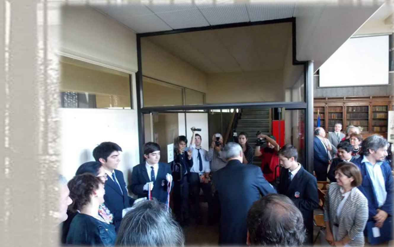
Inauguración del Archivo del Instituto Nacional